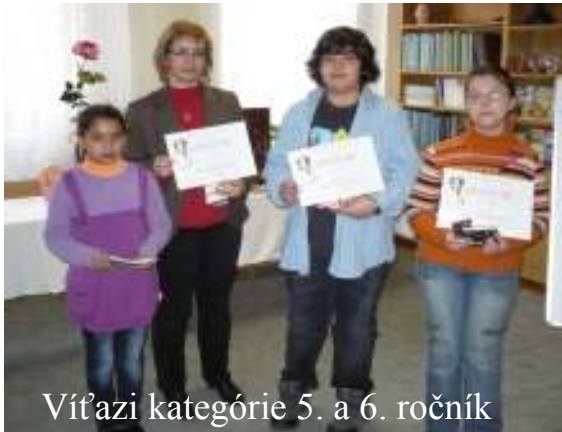
Víťazi kategórie 5. a 6. ročník

otvoreni samotnej súťaže zaznela myšlienka Honore de Balzaca, ktorý povedal: „Poézia a próza je dielo z najsvätejších“. Súťaž sa niesla v znamení významného výročia veľikána svetového mena, Alexandra Sergejeviča Puškina, ktorého 175. výročie smrti sme si pripomenuli len pred nedávnom – 10. februára 2012. Puškin, o ktorom je známe, že bol „ruskou jarou a ruským ránom“, svoj mladý život, ktorý žil, zobrazoval vo svojej tvorbe taký, aký v skutočnosti bol. Bol ruským národným básnikom, takým, ako Shakespeare pre Angličanov a Goethe pre Nemcov. Bol tvorcom literárneho jazyka, ktorý znel v súťažných ukázkach okresnej prehliadky Ars poetiky 2012. Okresné kolo tejto tradičnej, ale aj obľúbenej súťaže, ktorá má svoje ďalšie postupové kolá, organizuje náš okres ako jeden z mála na Slovensku. V okresnom kole súťaže Ars poetika v tomto roku súťažilo 17 žiakov v dvoch kategóriách – v kategórii žiakov 5. a 6. ročníka ZŠ a v kategórii žiakov 7. a 9. ročníka ZŠ (ZŠ Komenského, ZŠ Wolkerova, ZŠ s MŠ Pod Vinbargom, ZŠ Malcov a ZŠ s MŠ Zborov).