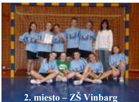
2. miesto – ZŠ Vinbarg