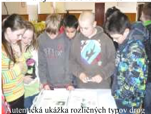
Autentická ukážka rozličných typov drog