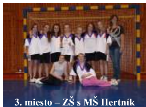
3. miesto – ZŠ s MŠ Hertník