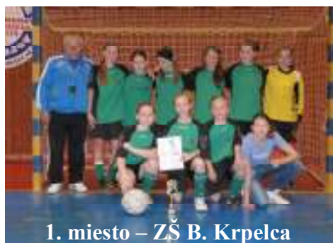
1. miesto – ZŠ B. Krpelca

Záverečné okresné kolo v malom futbale patrilo v športovej hale mladším žiačkam ZŠ, kde jasne bez straty bodov vyhrali dievčatá zo ZŠ B. Krpelca. Na druhom mieste skončila ZŠ Vinbarg a z tretieho miesta sa tešila ZŠ s MŠ Hertník. Základná škola B. Krpelca tak získala prvenstvo vo všetkých kategóriách.