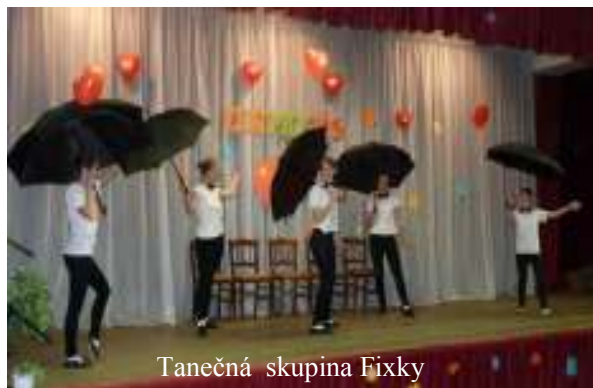
Tanečná skupina Fixky