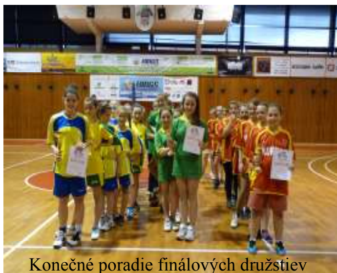
Konečné poradie finálových družstiev

Dňa 7.5.2012 prebehlo v športovej hale MIER okresné kolo vo vybíjanej žiačok základných škôl. Hralo sa v dvoch skupinách. V skupine „A“ a skupine „B“. Do finálového kola sa prebojovali ZŠ B. Krpelca, ZŠ s MŠ Pod Vinbargom a ZŠ s MŠ Hertník. Konečné poradie ich vzájomných zápasov skončilo nasledovne: