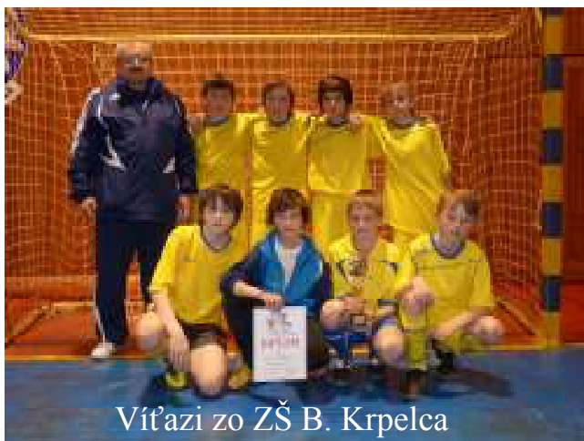
Víťazi zo ZŠ B. Krpelca

Starších žiakov vystriedali na palubovke mladší žiaci ZŠ. Aj tu sa turnaja zúčastnilo 16 družstiev. Na prvom mieste skončili chlapi zo ZŠ B. Krpelca, ktorí v dramatickom finálovom zápase remizovali so ZŠ Hažlín. O víťazovi okresného kola tak v závere rozhodli až pokutové kopy. ZŠ Hažlín v nich prehrala 1:3 a skončila na druhom mieste, tretie miesto si vybojovala ZŠ Raslavice.