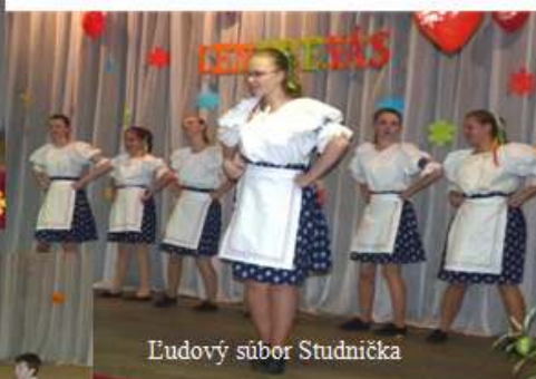
Ludový súber Studnička