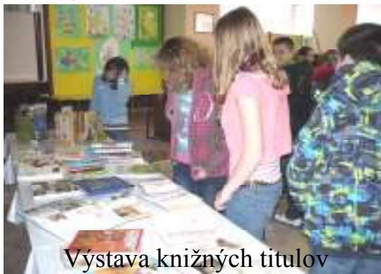
Výstava knižných titulov

definíciu knihy, tu je: „ Kniha sú listy papiera zviazané do textu “. Pridala aj niekoľko zaujímavostí o vzniku a formovaní tunajšej knižnice od jej počiatkov až po súčasnosť. Dozvedeli sme sa, že v historicky 1. knižnici, ktorá v našom meste vznikla v roku 1460, v blízkosti vtedy ešte Farského kostola sv. Egídia, sa nachádzalo 30 rukopisných kníh. Možno si mnohí povieme, že 30 kníh pre celé mesto je veľmi málo. No nesmieme zabúdať na to, že knihy sa prepisovali ručne