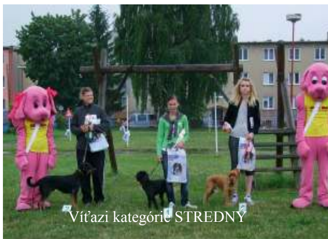
Víťazi kategórie STREDNÝ

Pre prítomných bolo pripravených mnoho zaujímavých atrakcií a súťaží. Zástupcovia kynologického klubu sa predviedli ukázkami psích športov, pripravené bolo veterinárne okienko, kde sa mohli majitelia psov poradiť s odborníkom, ale aj policajné okienko. Príslušníci policajného zboru v ňom zhrnuli všetky povinnosti majiteľa psa, ktoré mu vyplývajú zo zákona a odpovedali aj na prípadné otázky publika. (Všetky dôležité informácie nájdete v interview pod článkom). Okrem iného boli pripravené súťaže s názvom Najšikovnejší pes , kde musel majiteľ spolu so psom prebehnúť prekážkovú dráhu v čo najkratšom čase a súťaž Ukáž čo vieš , voľnú disciplínu, v ktorej majitelia predviedli, aké „psie kúsky“ ich domáci miláčikovia stvárajú. Pri tejto disciplíne porota upozornila na to, že každý pes, čistokrvný alebo „miešanec“, veľký alebo malý, je cvičiteľný a záleží len od majiteľa psa a jeho prístupu k nemu, do akej miery ho bude pes počúvať.