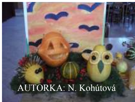
AUTORKA: N. Kohútová

Počas tretieho októbrového týždňa (19.10.2011) sa v CVČ v Bardejove uskutočnil 3. ročník súťaže v aranžovaní prírodných, jesenných materiálov, pod názvom Jeenná nádhera. Podujatie, na ktorom sa zúčastnili žiaci zo šiestich základných škôl v okrese, ponúklo šikovným mladým aranžérom možnosť a priestor, aby predviedli svoje záujmy, tvorivosť a nápaditosť. Počas svojej