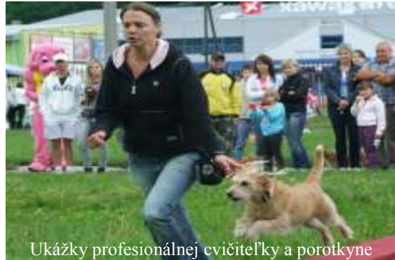
Ukážky profesionálnej cvičiteľky a porotkyne

Na akcii sa zúčastnili aj členovia združenia SOS psíky. Niektorí z ich štvornohých zverencov sa zapojili do výstavy a jednotlivých súťažných kôl, v ktorých dokázali, že aj „nechcený“ psík vie byť veľmi šikovný a poslušný. Celá výstava sa uskutočnila aj za pomoci štedrých sponzorov. Hlavným sponzorom podujatia bola sieť obchodov Super Zoo. Hlavný sponzor venoval každému prihlásenému majiteľovi drobnú pozornosť a poukážku na nákup v Super Zoo Bardejov. Ďalšími sponzormi boli: Kipech – strojárská výroba Prešov, AB Tlačiareň Bardejov a Centrum voľného času. Pre všetkých ocenených boli pripravené zaujímavé ceny. Napriek nepriaznivému počasiu môžeme povedať, že 1. ročník Výstavy psov orieškov a bezpapierakov bol úspešný a budeme sa tešiť na jeho ďalšie pokračovanie, ktoré sa možno pretransformuje aj do podoby tradície.